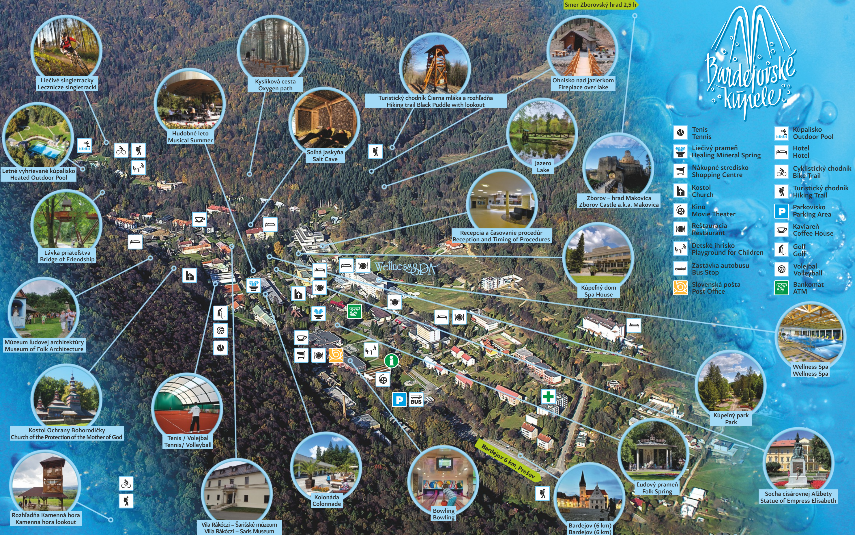
Liečivé singletracky Lecznicze singletracki