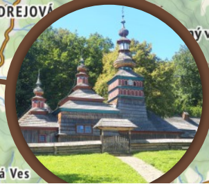
BARDEJOVSKÉ KÚPELE 6 km Múzeum ľudovej architektúry 054 472 20 72